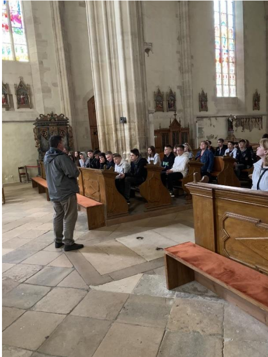
SZENT MIHÁLY TEMPLOM