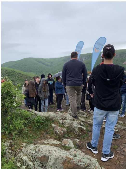
TORDAI – HASADÉK