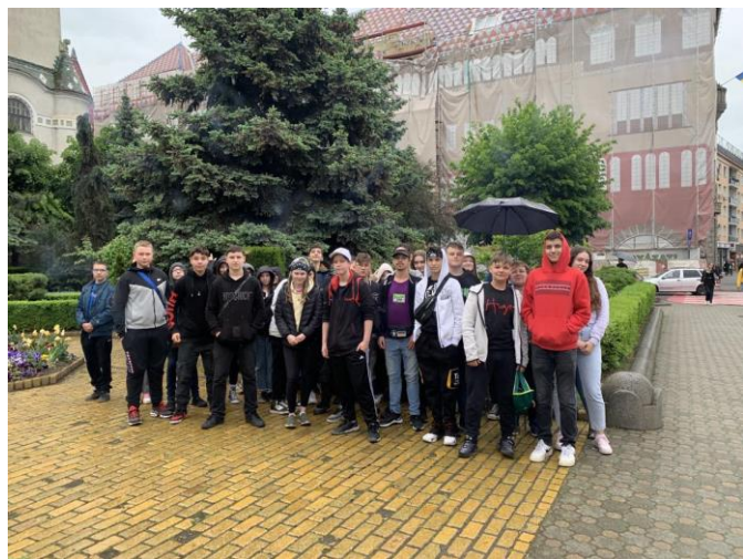
MAROSVÁSÁRHELY - KULTÚR PALOTA

A Bolyai Múzeumot és a Petőfi-domborművet az első napi esőzés miatt nem tudtuk meglátogatni.