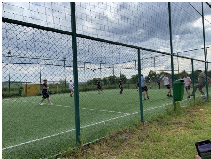
FOCIMECCS A BALAVÁSÁRI GYEREKEKKEL

Miután visszaérkeztünk Balavásárra, a helyi gyerekek meghívására kimentünk az ott található iskola focipályájára, és meccset játszottunk velük. Az estét a gyerekek kikapcsolódással, társasjátékokkal töltötték.